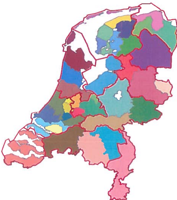
Begrenzing van de circa 40 agrarische collectieven (kaartbeeld 30 juli 2015).

Het agrarisch natuurbeheer wordt geregisseerd door de provincies. In 12 provinciale natuurbeheerplannen wordt aangegeven welke doelsoorten (overwegend vogelsoorten) waarvoor Nederland een internationale verantwoordelijkheid heeft, op welke plaatsen het beste kunnen worden beschermd. Vervolgens krijgen de circa 40 opgerichte collectieven exclusief de gelegenheid om ‘aan de voordeur’ offerte uit te brengen aan de provincies en ‘aan de achterdeur’ afspraken te maken met de leden c.q. de betrokken boeren en eventuele andere grondeigenaren. Deze plannen hebben een zeer specifieke op biodiversiteit gerichte strekking. Ten tweede is er de mogelijkheid van toekenning van directe inkomenssteun voor (kleine groepen van) boeren, onder voorwaarden zoals gewasdiversificatie, blijvend grasland, de teelt van vanggewassen en de inzet op ecological focus areas . Collectieven kunnen ook bij deze vergroeningsmaatregelen een rol nemen in de onderlinge afstemming. Als derde wordt de grondeigenaren en collectieven gesuggereerd hun inkomens aan te vullen met diensten in het kader van de inmiddels urgente wateropgave in opdracht van de waterschappen.