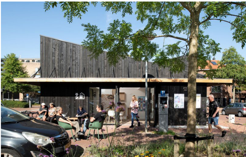
Beeld: Michi Noeki in Groningen

Ook binnen het woningaanbod in een wijk is het zaak te mengen: Stuur bij stedelijke verdichting en herstructurering aan op het creëren van gemengde stedelijke gebieden met een breed scala aan woonvormen, passend bij het karakter van de wijk. Op deze manier wordt (of blijft) een wijk aantrekkelijk voor diverse groepen in de samenleving. Daarbij maakt een gevarieerd woningaanbod diverse wooncarrières binnen de wijk mogelijk en wordt de levendigheid, draagkracht en sociale veiligheid in de buurt vergroot. Ook zorgt het voor wijken waar mensen met verschillende sociaal-economische positie elkaar kunnen tegenkomen op straat, bij de sportclub, of op school. Dit vraagt om een voorzieningenaanbod in de wijk die gericht is op, en uitnodigend is voor de gemengde bevolkings-samenstelling van een wijk.