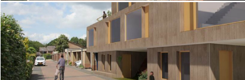
Beeld: Splitswoningen