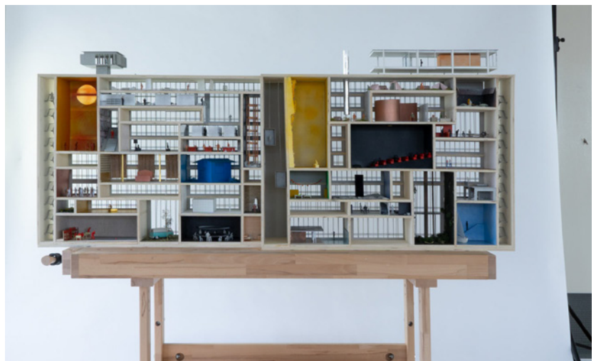
Beeld: Maquette Park Palace