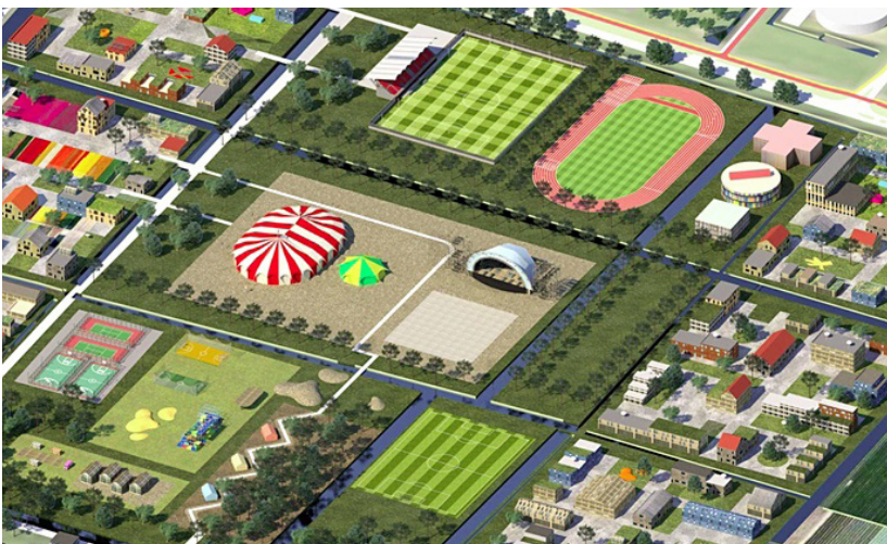
Beeld: inzoom van het Multifunctioneel park