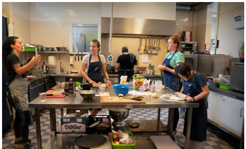
Beeld: Skills in de stad Maastricht

In de voormalige kazerne van de Marechaussee (KMAR) in Maastricht komen 30 woonplekken om kwetsbare jonge mensen betere kansen te geven. Nederland telt veel jongeren die zonder diploma, of door andere omstandigheden, moeilijk aan het werk kunnen komen. Deze jongeren verdienen een extra steuntje in de rug. Daarvoor hebben het Rijksvastgoedbedrijf en het Atelier Rijksbouwmeester in samenwerking met ICS-Advies, de Skills in de Stad aanpak ontwikkeld. De jongeren volgen een Skills programma van leren en werken met coaching en krijgen daar een eigen woonplek. Na circa twee jaar stromen de deelnemers door naar een eigen woonplek elders, waar ze zelfstandig wonen.