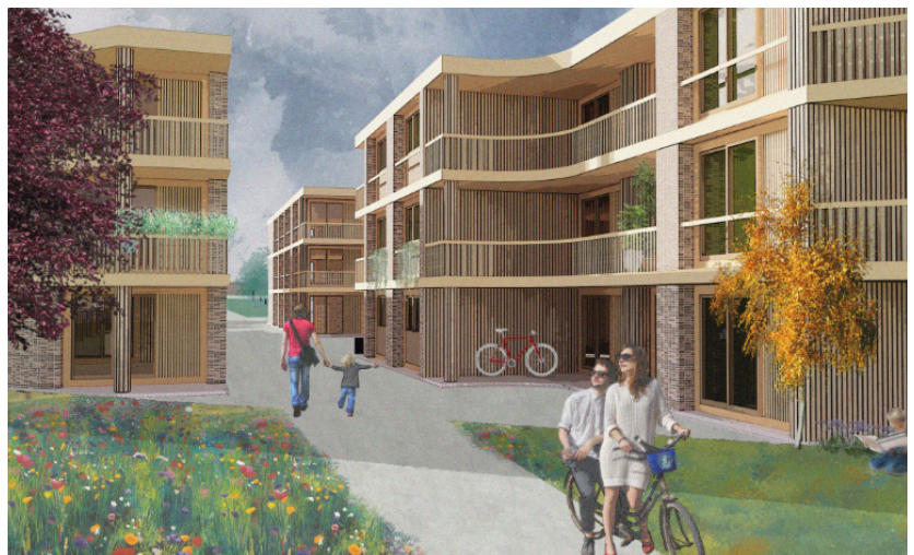
Beeld: Visualisatie van Binnen Haven Almere

Het leidde tot een winnend project Binnen Haven van o.a. Bureau SLA dat daadwerkelijk werd omarmd door de gemeente Almere en leidde tot de oprichting van een wooncoöperatie om de ontwikkeling van dit nieuwe hofje mogelijk te maken.