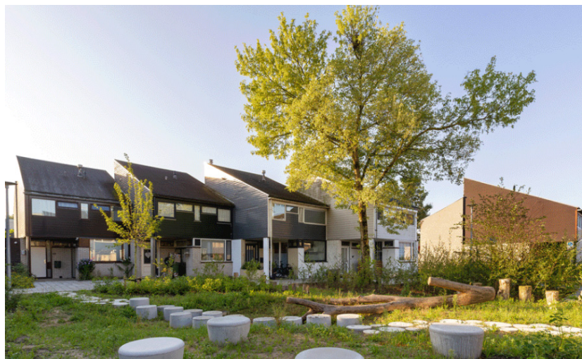
Beeld: Herinrichting van één van de hoven in Mosterdhof

Mosterdhof is een typische jaren '70 wijk van zo'n 750 inwoners in de gemeente Westervoort in Gelderland. Ontstaan vanuit de prijsvraag Panorama Lokaal geïnitieerd door het CRa heeft een winnend team van o.a. Barzilay+Ferwerda met het ontwerp Mooi Mosterdhof een langdurige samenwerking tussen bewoners en diverse stakeholders op gang gebracht waarmee een bestaande wijk daadwerkelijk groener, veiliger en leefbaarder is geworden. Het project focuste op drie sporen: op de aanpak van openbare ruimte op wijkniveau, de groene hoven en het verduurzamen van de woningen zelf. Samen is een toekomstbestendige wijk gebouwd, waarin elke bewoner zich thuis voelt en trots kan zijn op zijn leefomgeving.