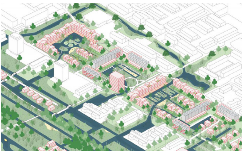
Beeld: Ontwerp Lage Weide in Westwijk

Aanvullend liggen er voor wijken aan de stadsranden kansen om de openbare ruimte te verbeteren door een vloeiendere overgang van stad naar land te creëren. Door het omliggende landschappelijke structuren en routes door te laten lopen in de wijk, ontstaan er betere verbindingen met bos, weiland, water of strand. Daarmee worden ook diverse vormen van actieve mobiliteit gestimuleerd, zoals wandelen en fietsen.