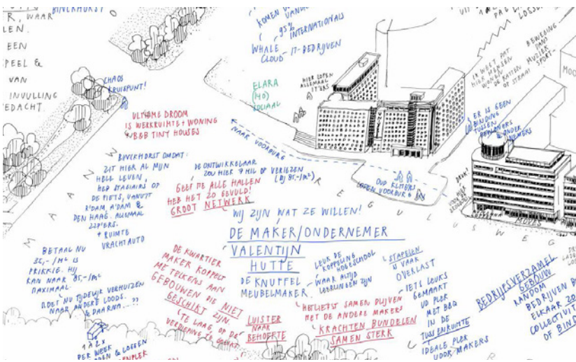
Beeld: Gastvrij Rijk Bron: Nadia Nena Pepels, 2022

Waak in participatieprocessen voor het idee dat je als gemeente of andere organisatie actief in de wijk enkel zaken wil 'ophalen'. Draai het om: stel de vraag open aan bewoners wat hun ideeën zijn en vraag wat ze hiervoor nodig hebben en biedt zo daadwerkelijke ondersteuning.