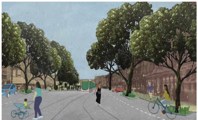
Beeld: toekomstbeeld Beijerlandse laan

Door middel van een ontwerp onderzoek is door Posad Spatial Strategies de problematiek en de potentie van de Beijerlandse laan en het aangrenzende gebied in Rotterdam Zuid geanalyseerd. Het is een plek geworden waar geld wordt witgewassen, illegaal gokken plaatsvindt en andere illegale praktijken tot het recente verleden ongestoord plaats konden vinden. In dit rapport worden aan de hand van tien thema's oplossingsrichtingen voor een ruimtelijk, programmatisch en sociaal ontwerp in relatie tot de aanpak van ondermijnende criminaliteit verkend. Zo kan de oorspronkelijke grandeur van deze levendige boulevard op Zuid in ere worden hersteld.