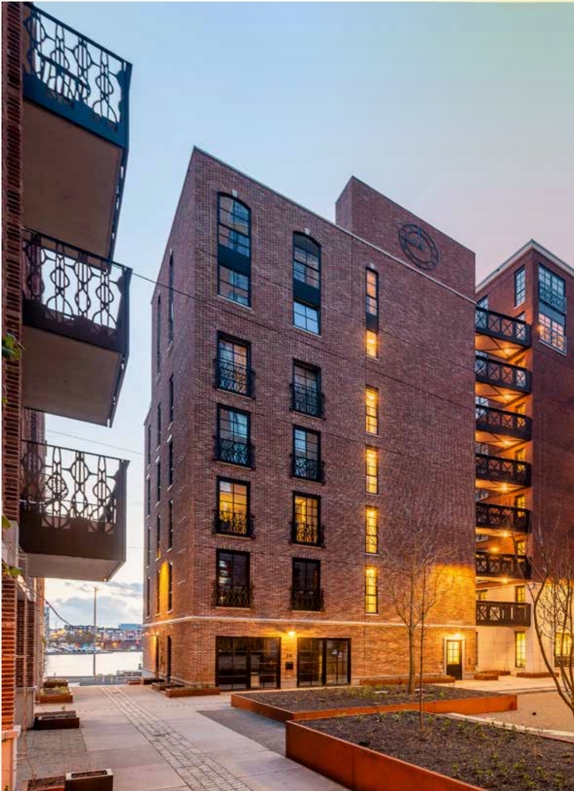
Little C, Rotterdam

Ontwerpteam: CULD en Inbo - Opdrachtgever: ERA Contour & J.P. van Eesteren | TBI