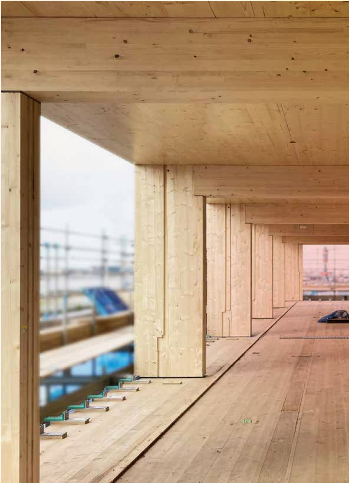
Stories, Amsterdam – hoogste houten hybride gebouw van Nederland Ontwerp: Olaf Gipser Architects – Opdrachtgever: BSH20A (CPO)