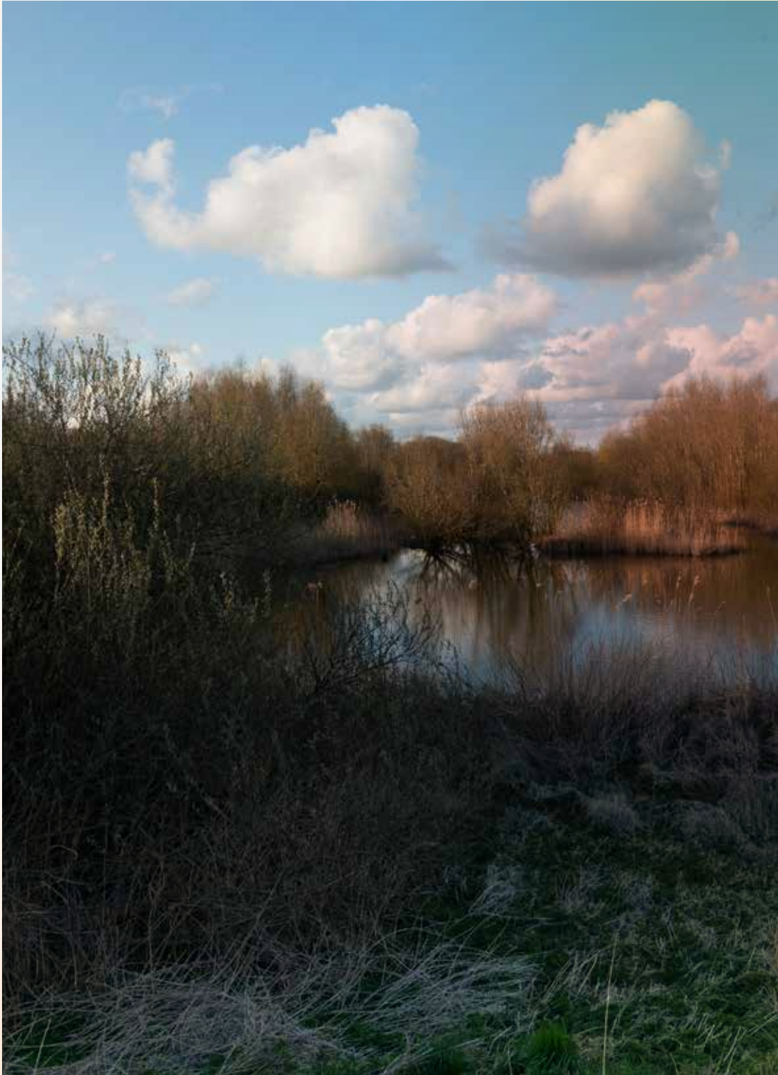
Vloevelden Suikerunie - voormalige vuilnisbelt, Groningen