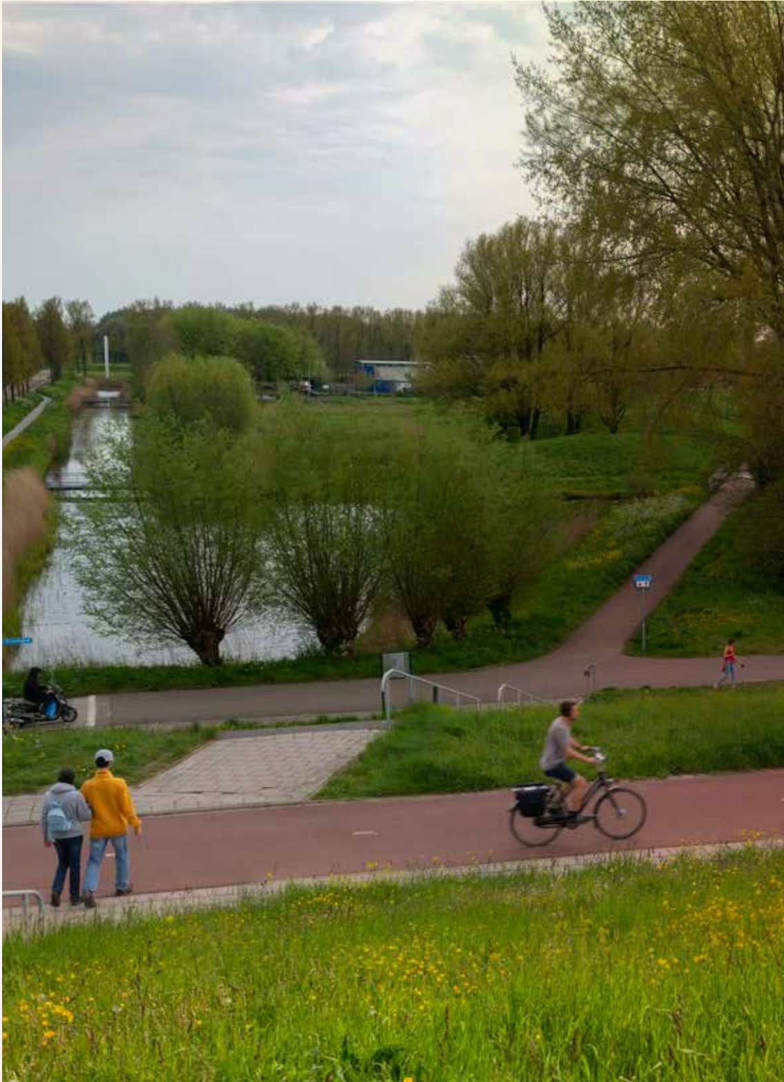
Balijbos, jong bos tussen Den Haag en Zoetermeer